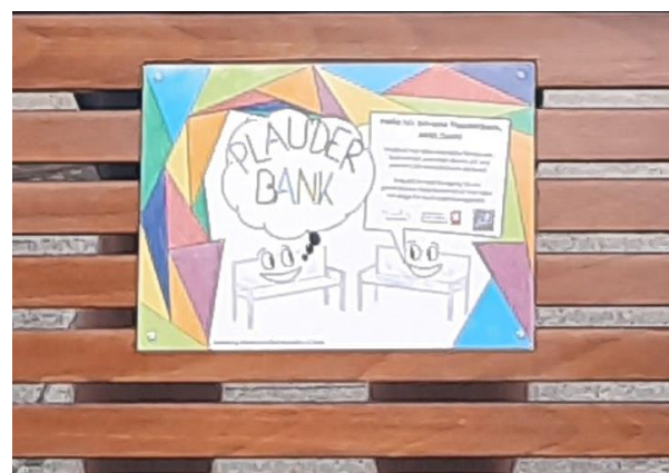
Abb. 1: Plauderbänke;