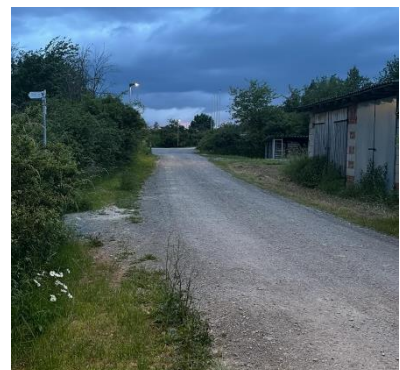
Abb. 5: Einbau der Besucherbeleuchtung; Fotos: Johannes Hümpfner