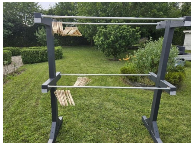
Abb. 2: mobile Garderobe