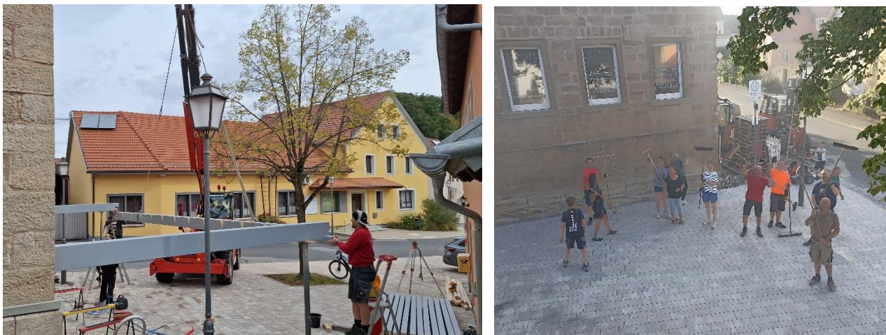
Abb. 8: Überdachung und Pflasterung in Reichenbach; Fotos: Fabian Nöth