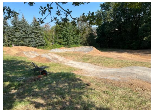
Abb. 15: Bike Trail; Fotos Marco Heinickel