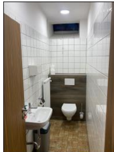
Abb. 14: Arbeiten am Jugendraum; Fotos: Lukas Then