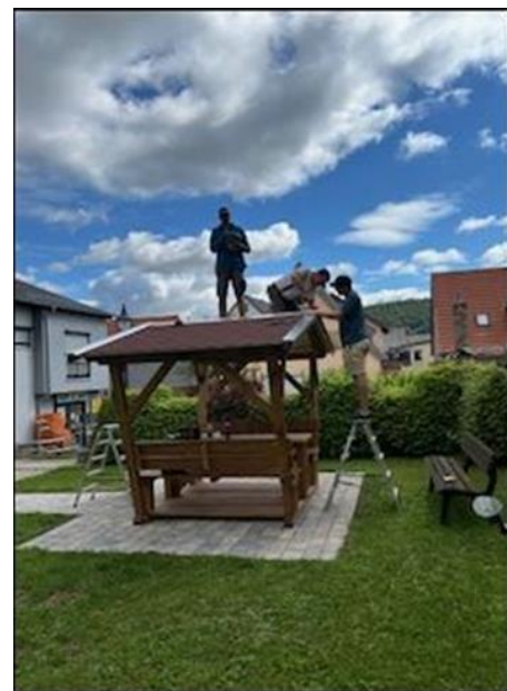
Abb. 7: Kommunikationslaube; Foto: Matthias Mangold