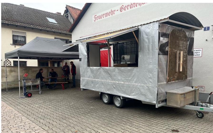
Abb. 9: Unser Festanhänger; Foto: Patrick Gottwald