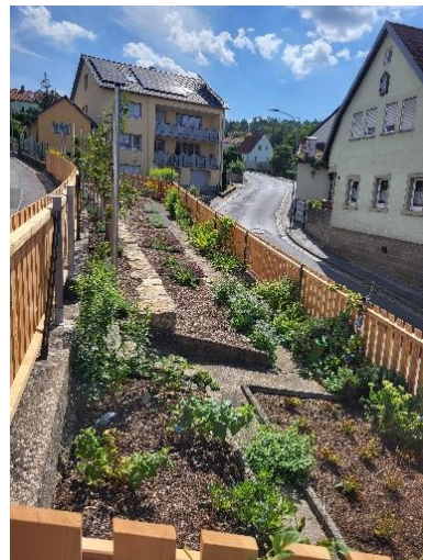
Abb. 4: Naschgarten und Staudenbeet