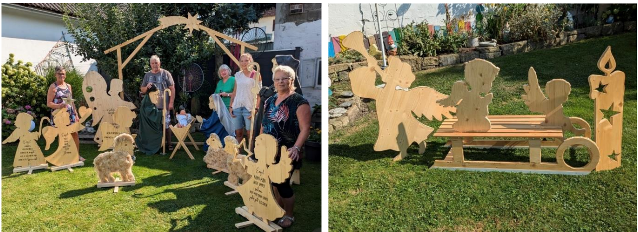
Abb. 3: das Initiativteam „Engelweg“ und die verschiedenen Elemente