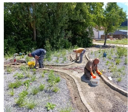
Abb. 6: Insektengartle in Burghausen