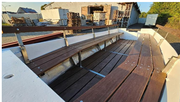
Abb. 18: Vereinsboot Mathilde in seiner schönsten Pracht; Fotos: Michael Rauch