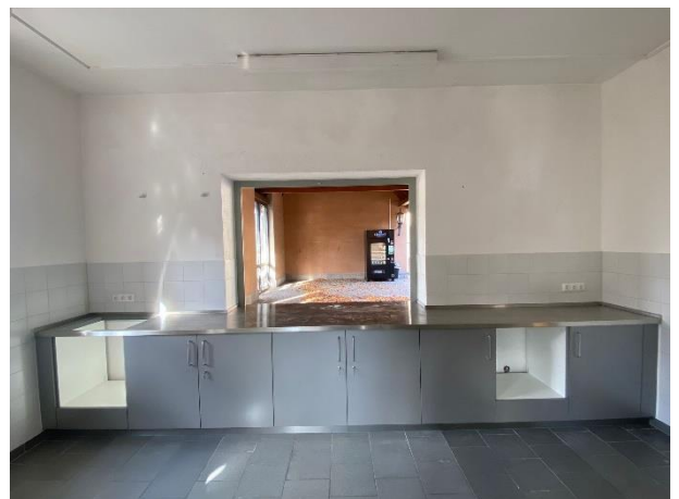
Abb.11: Umbau des Backhauses mit vergrößerten Fenstermodulen und Küche