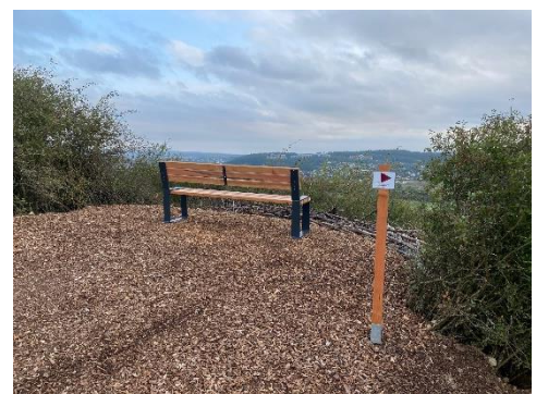
Abb. 10: Stationen der Panoramawege; Fotos: Helmut Köberlein