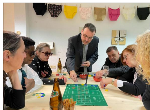
Abb. 17: Waschsalon Else und Veranstaltungen darin