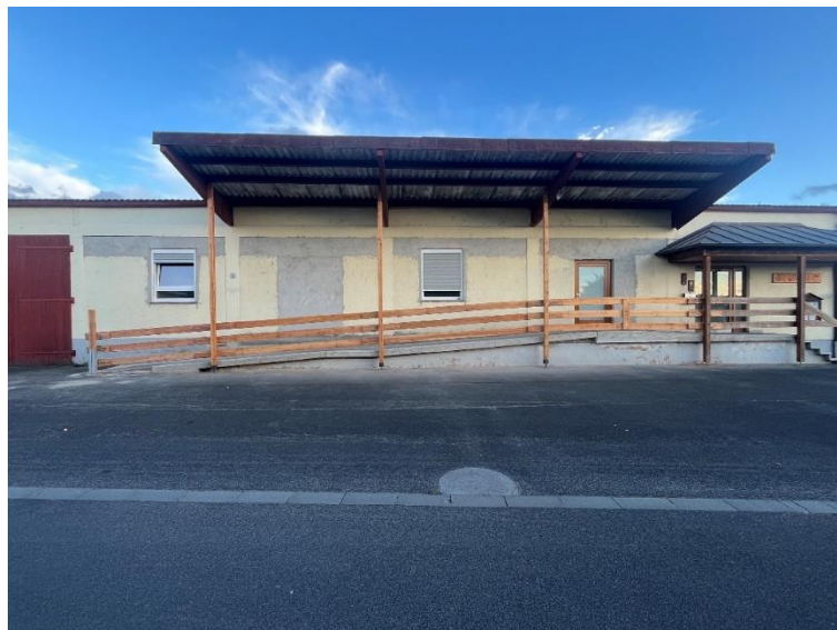
Abb. 13: barrierefreie Rampe als Zugang für beide Vereinsräume