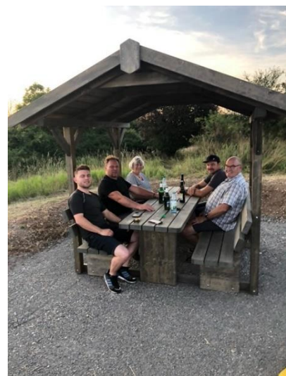
Abb. 16: die überdachte Sitzgruppe im Sonnenuntergang; Fotos: Luise Mayer-Bieber